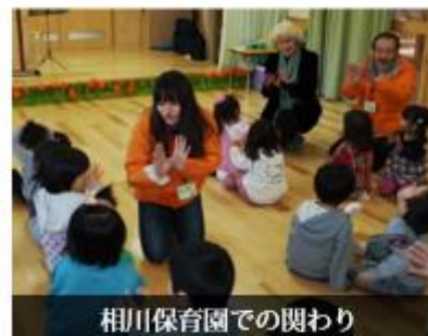
相川保育園での関わり