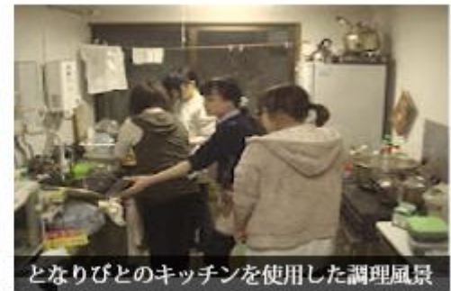
となりびとのキッチンを使用した調理風景