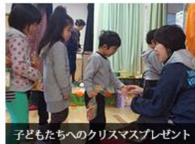
子どもたちへのクリスマスプレゼント