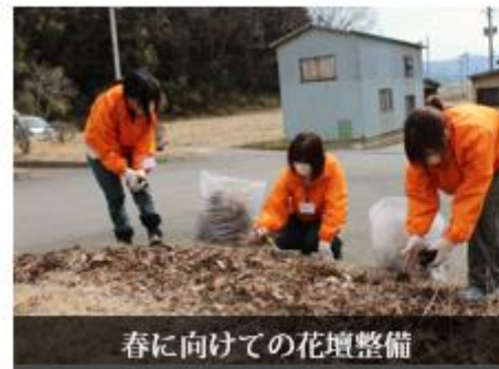
春に向けての花壇整備