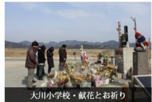
大川小学校・献花とお祈り