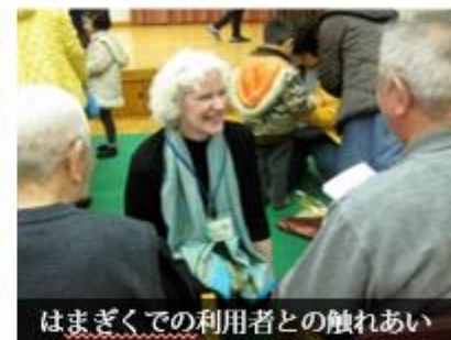
はまぎくでの利用者との触れあい