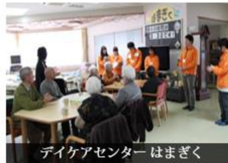
デイケアセンターはまぎく