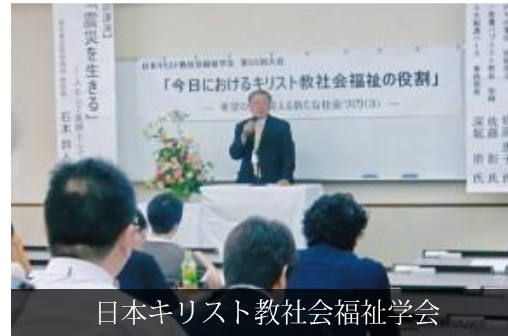
日本キリスト教社会福祉学会