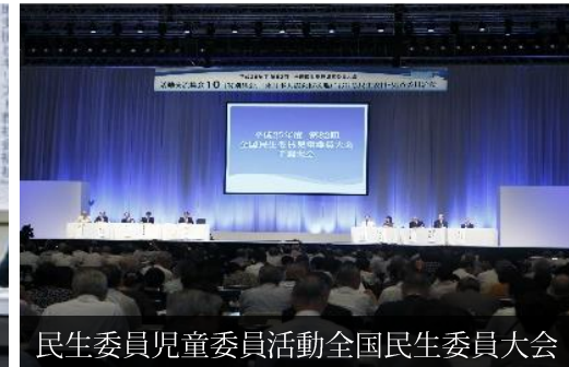
民生委員児童委員活動全国民生委員大会