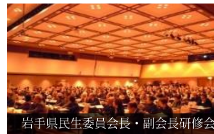
岩手県民生委員長・副会長研修会