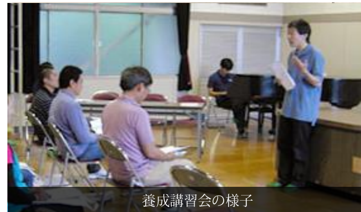
養成講習会の様子