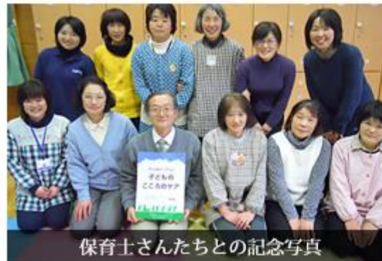
保育士さんたちとの記念写真