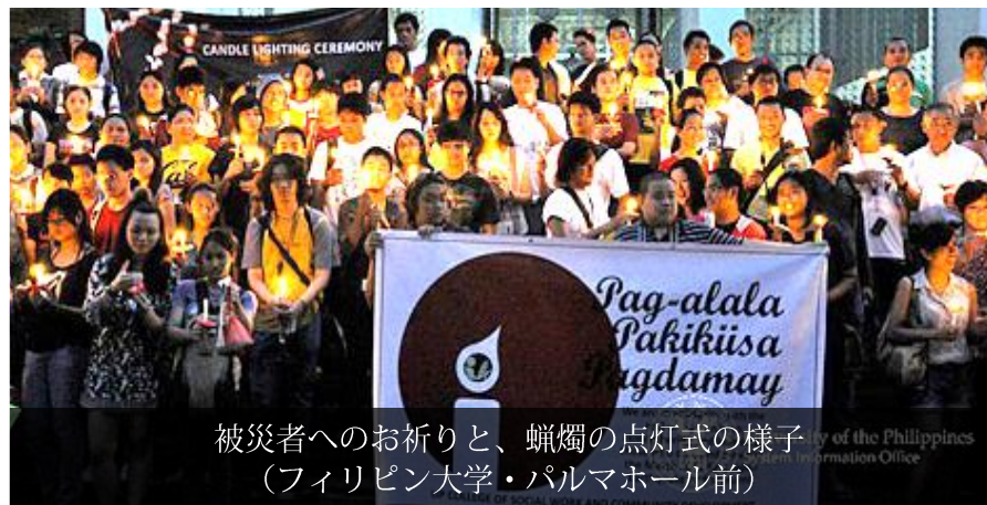
被災者へのお祈りと、蠟燭の点灯式の様子 (フィリピン大学・パルマホール前)