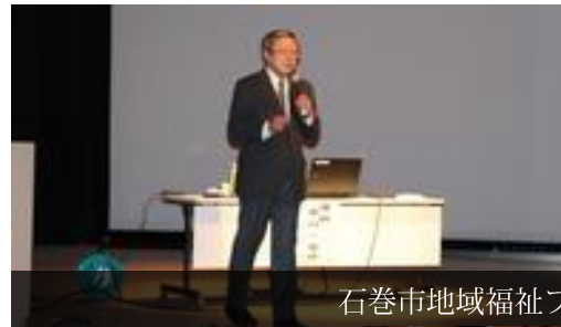
石巻市地域福祉フォーラムでの講演