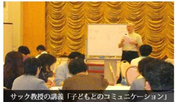
サック教授の講義「子どもとのコミュニケーション」